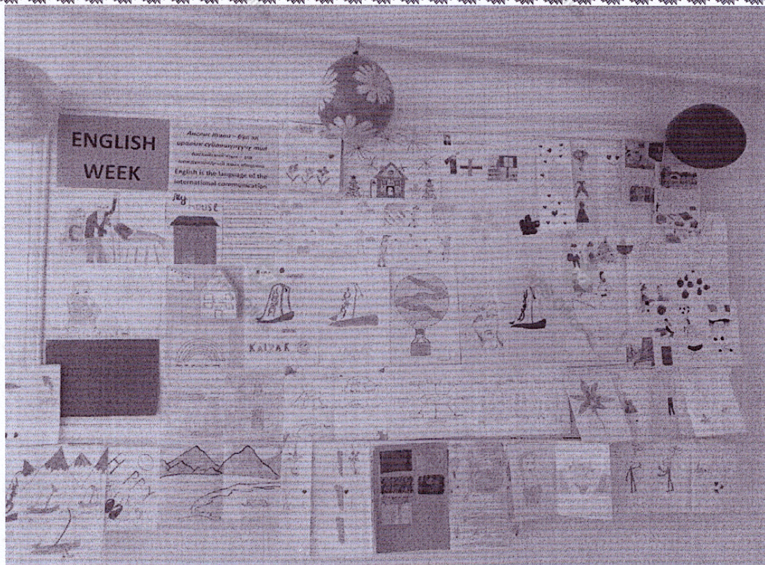
5-10 класска чейинки англис тили боюнча конкурс