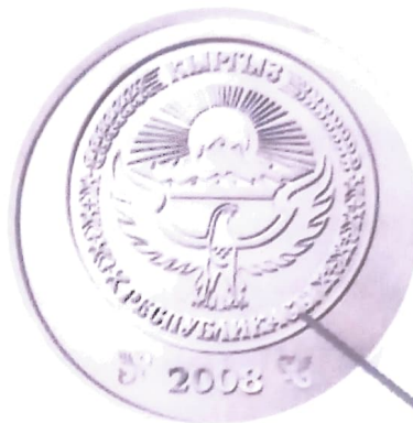
Аверс - тыйындын бет маңдай жагы